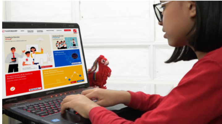
Programas de control social en modalidad virtual.

Durante la pandemia por Covid-19, la Contraloría General del Perú transformó a la modalidad virtual sus programas de control social: “Auditores Juveniles” y “Monitores Ciudadanos de Control”, los cuales vienen operando exclusivamente en forma remota para identificar irregularidades y oportunidades de mejora en la gestión pública.