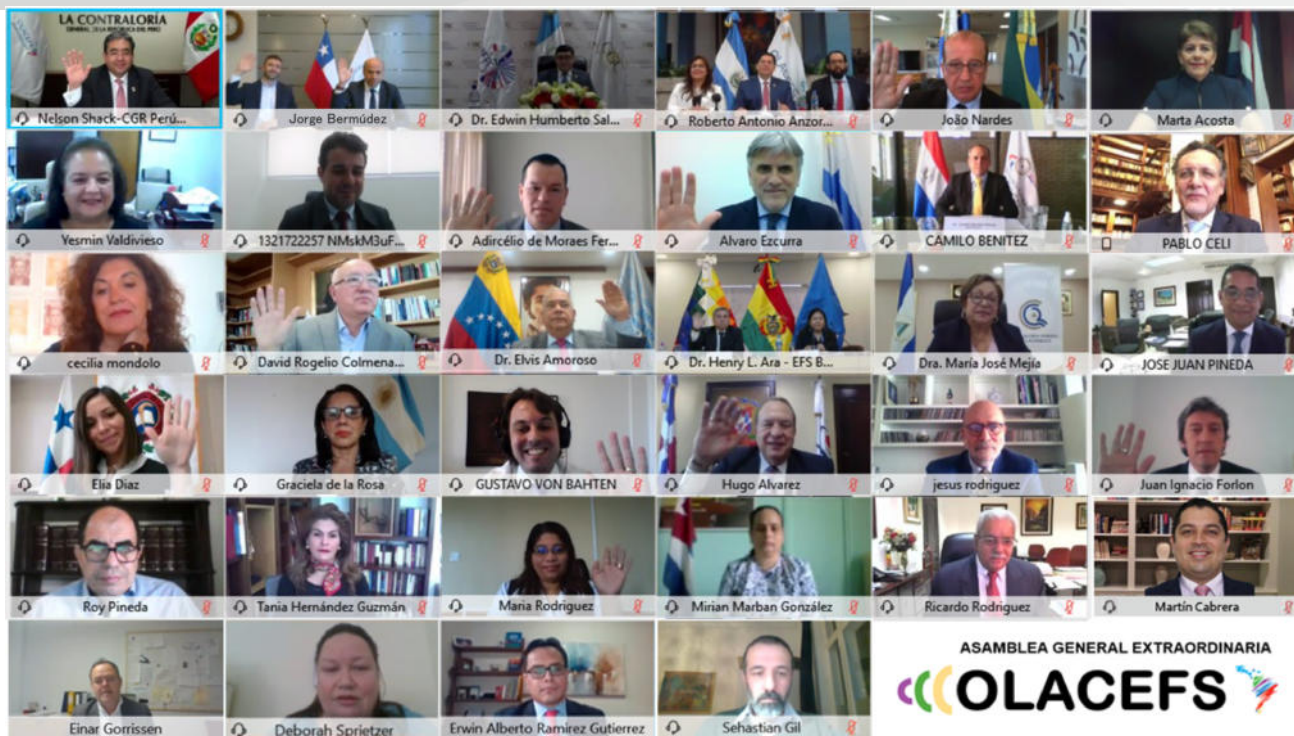
Fotografía oficial de la Asamblea General Extraordinaria OLACEFS 2020.

Edición No. 38 | octubre - diciembre, 2020 | Lima, Perú