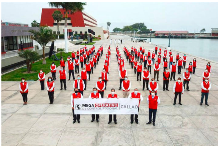
Inicio del Megaoperativo de Control Regional en el Callao.

Cada región es intervenida durante cuatro meses en promedio al término del cual se informa a la ciudadanía sobre los resultados del control gubernamental, para promover la transparencia y la rendición de cuentas de las autoridades. El avance en la ejecución de los Mega Operativos de Control se reporta periódicamente en el portal www.contraloria.gob.pe , Sección Prensa.