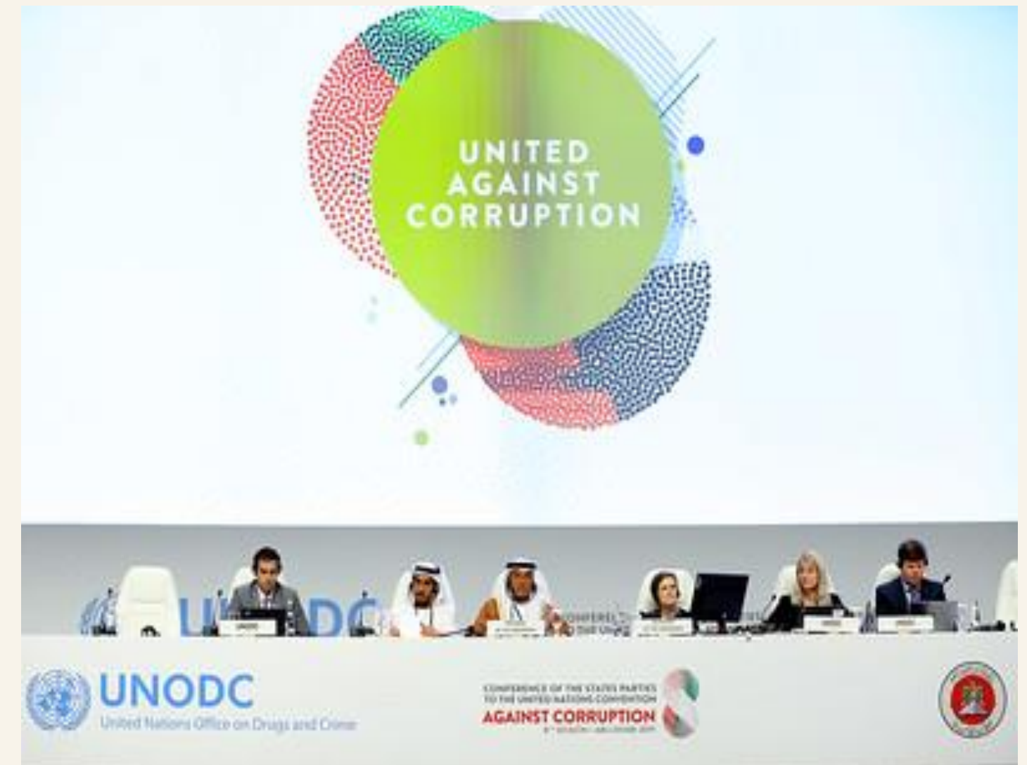
La octava sesión de la Conferencia de los Estados Partes de la Convención de las Naciones Unidas contra la Corrupción, en Abu Dabi, Emiratos Árabes Unidos, en 2019.