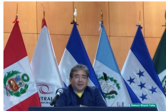
Presidente de la Fuerza de Tarea.