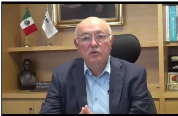
Presidente del GTFD