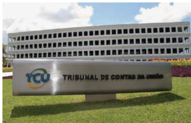
Edificio sede del Tribunal de Cuentas de la Unión (TCU) de Brasil

El TCU pasará a liderar el Comité de Creación de Capacidades (CCC) de la OLACEFS y a nivel global presidirá el Comité de Normas Profesionales (PSC, en inglés), ambos cargos que representan no sólo enormes desafíos, sino también la responsabilidad de darle continuidad a los trabajos de creación de capacidades a nivel regional y contribuir de manera significativa con la próxima Presidencia de la OLACEFS para fortalecer aún más los lazos entre la región y la amplia comunidad de la INTOSAI.