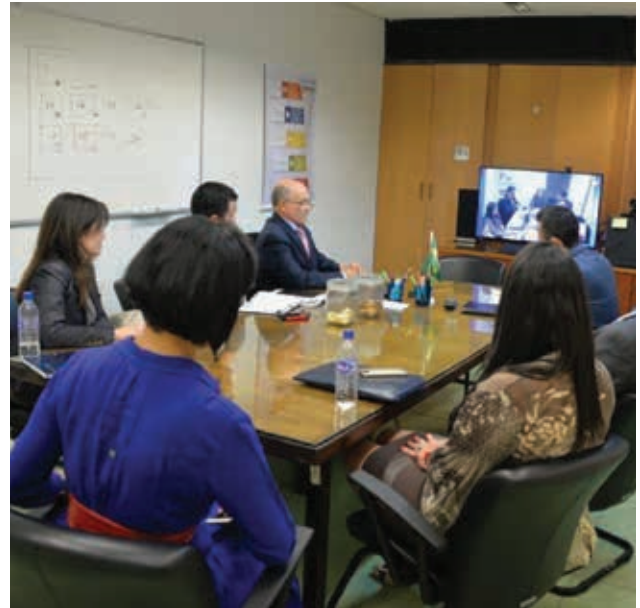
Equipo de la EFS de Brasil durante la votación para la nueva Presidencia del CCC.