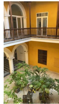
Interior del Palacio

Salón Simón Bolívar, sede para la reunión del CCC los días 29 y 30 de noviembre, así como para el Consejo Directivo el 1 de diciembre, estará disponible hasta el 3 de diciembre como una de las salas de networking