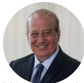
Ministro Augusto Nardes Presidente del CCC

Quisiera invitar a las EFS de la región, a todos los interesados, a ciudadanos y a organizaciones internacionales a conocer en detalle las distintas actividades de capacitación del CCC para el próximo trienio y en qué medida ellas contribuyen al perfeccionamiento de las EFS de la comunidad OLACEFS.