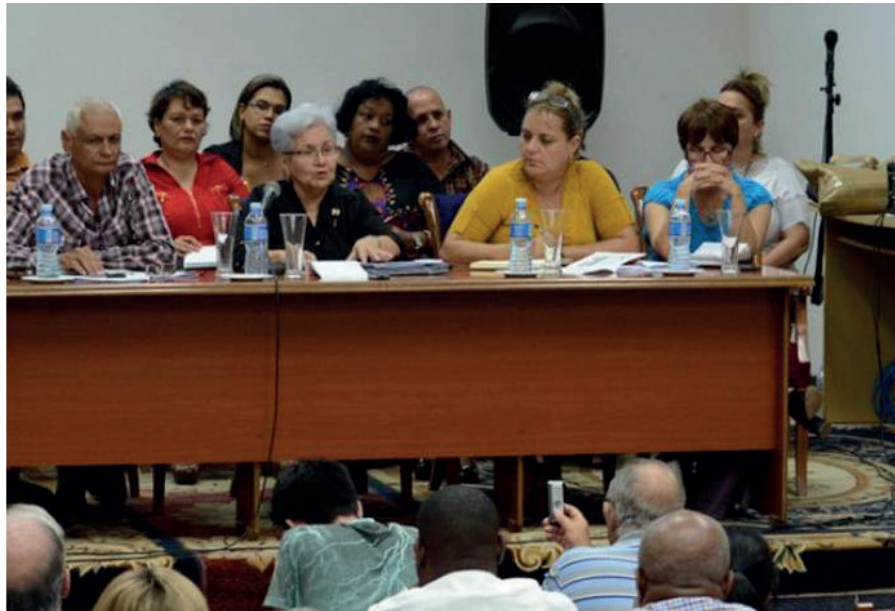
A Controladora Gladys Bejerano na apresentação do Balanço de Desempenho do Sistema de Auditoria em Camagüey.

A Controladora Geral da República, Gladys Bejerano Portela, iniciou na província de Camagüey o convite para realizar auditorias estratégicas em todo o país, simultaneamente com a XIV Verificação de Controle Interno (CNCI) que será realizada desde 6 de abril até 21 de maio em 321 entidades econômicas selecionadas.