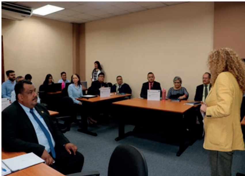
Formação sobre o Sistema Integrado de Controlo de Auditoria (SICA).

O desenvolvimento deste sistema informático tem como objetivo reforçar a gestão das auditorias governamentais e contribuir para melhorar o tempo e a qualidade das auditorias.