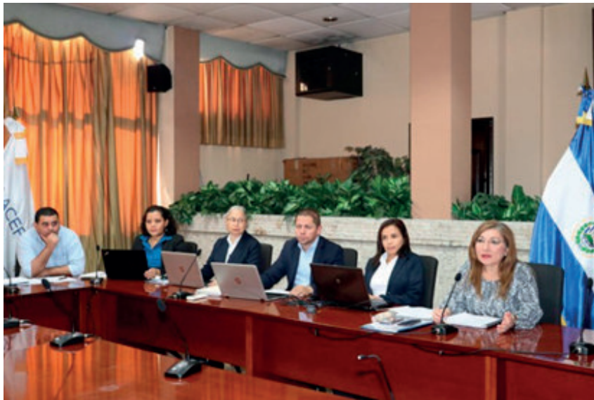
Equipe da EFS El Salvador participando do workshop virtual.

No seguimento das atividades da iniciativa "Estratégia, Medição de Desempenho e Relatórios" (SPMR), implementada na região OLACEFS em colaboração com o IDI-INTOSAI, foi realizado o Segundo Workshop Virtual sobre a avaliação do Capítulo 4, correspondente à Metodologia do Marco de Medição de Desempenho (MMD), um processo que está sendo executado atualmente pelo Corte de Contas da República de El Salvador em conjunto com as EFS de Honduras, Peru e Equador.