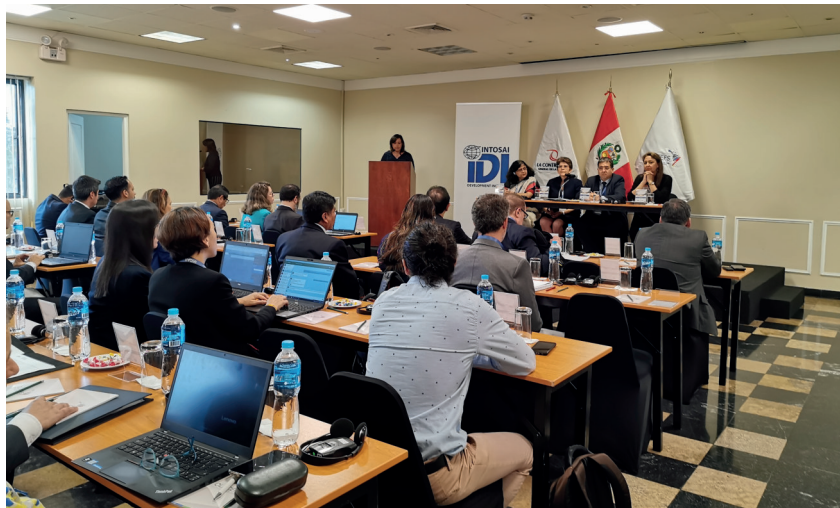
Inauguração do Workshop sobre Compras Públicas Sustentáveis usando Análise de Dados (CASP).

Considerando a experiência da OLACEFS em auditorias coordenadas da preparação da Agenda 2030, este ano o IDI e a OLACEFS decidiram continuar consolidando a cooperação existente e fomentar uma auditoria cooperativa na implementação da ODS, tendo a Controladoria Geral da República da Costa Rica como EFS coordenadora.