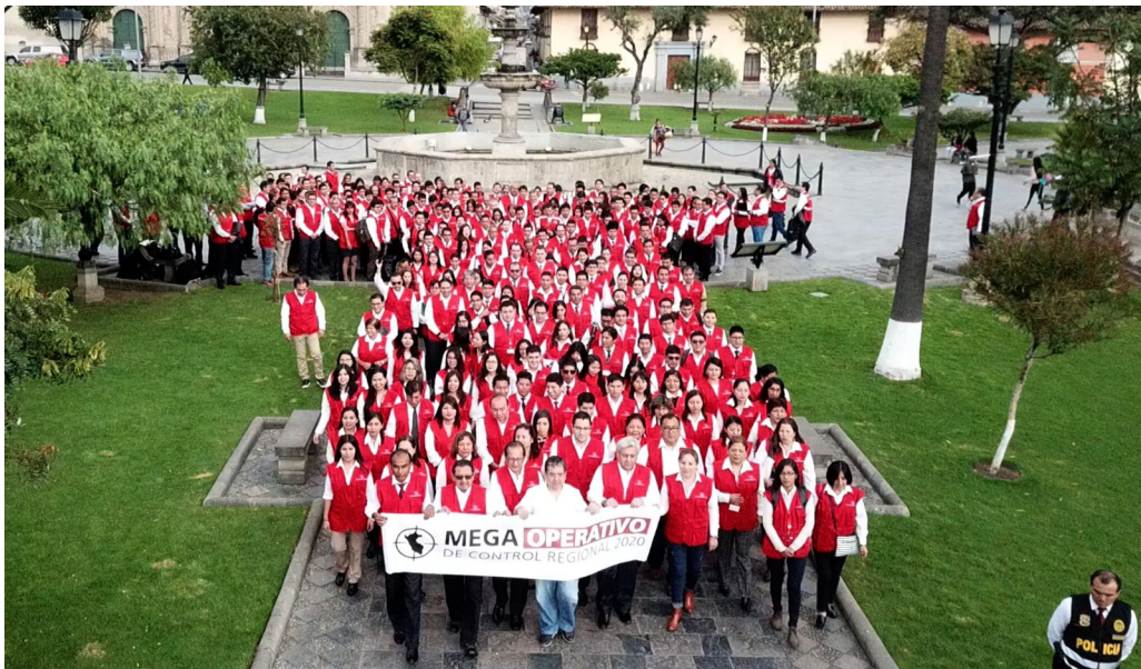
Início da Mega Operação de Controlo Regional em Cajamarca, Peru.

Na segunda-feira, 9 de março, o Controlador-Geral da República do Peru, Nelson Shack, deu início à primeira Mega Operação de Controlo Regional na região de Cajamarca com o destacamento maciço de cerca de 700 auditores e especialistas da entidade superior de controle, que realizarão intervenções nas principais entidades públicas localizadas nas treze províncias da região. Os auditores realizarão um total de 760 intervenções, das quais 352 serão serviços de controlo subsequentes e simultâneos, enquanto 408 ações de prevenção e integridade serão levadas a cabo.