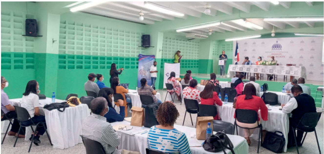
Desenvolvimento de oficinas voltadas para associações sem fins lucrativos.

As oficinas realizadas durante as reuniões foram: Conscientização sobre Responsabilidade, pelo Departamento de Controle Social da instituição de auditoria; Código de Conduta, promovido pela ONG Alianza; Diretrizes para a apresentação de Projetos, pelo Centro Nacional de Promoção e Desenvolvimento das ONPs do Ministério da Economia, Planejamento e Desenvolvimento; e Elaboração de um Relatório para ONGs, pela Divisão de ONGs da Diretoria de Análise Orçamentária do CCRD.