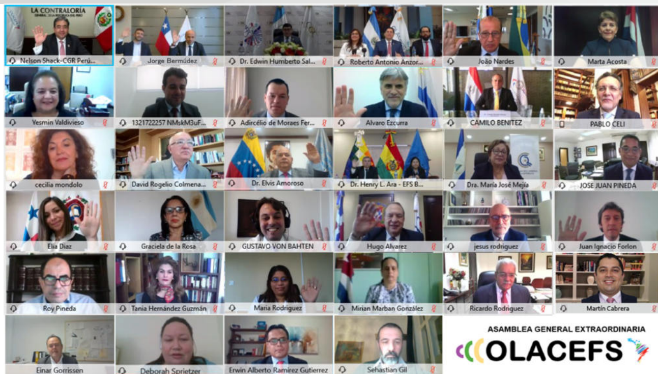
Foto oficial da Assembleia Geral Extraordinária da OLACEFS 2020.

Edição No. 38 | Outubro - Dezembro, 2020 | Lima, Peru