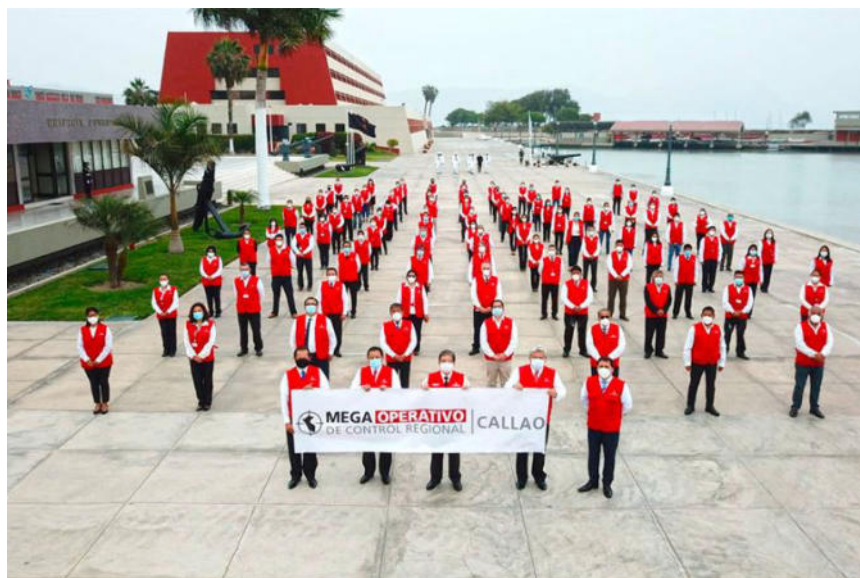
Início da Megaoperação de Controle Regional em Callao.

Cada região é auditada por uma média de quatro meses, após o qual o público é informado sobre os resultados do controle governamental, a fim de promover a transparência e a responsabilidade das autoridades. O progresso na execução das Mega Operações de Controle é relatado periodicamente no portal www.contraloria.gob.pe , Seção de Imprensa.